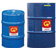
Vloeistofvat metaal 60 liter 200 liter