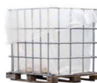
Kooipallet 1000 liter