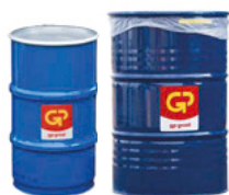
Dekselvat metaal 60 liter 200 liter