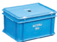
Batterijbox kunststof 20 liter