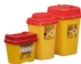
Naaldenbox kunststof 2 liter 4 liter 7 liter