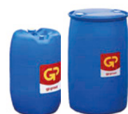
Vloeistofvat kunststof 60 liter 200 liter