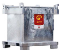
ASP container 800 liter