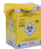
Naaldenbeker doos 50 liter