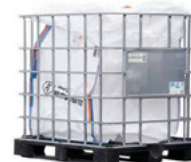
Kooipallet met UN Bigbag 1000 liter