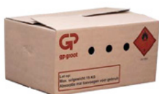
Spreiendooz 70 liter