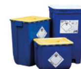
Ziekenhuisvat vlak deksel 30 liter 50 liter 60 liter