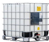
IBC container 1000 liter