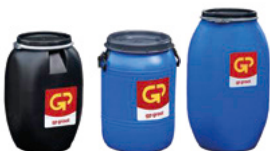
Dekselvat kunststof 60 liter klembanddeksel 60 liter schroefdeksel 120 liter 200 liter